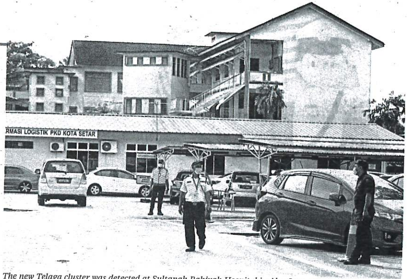
The new Telaga cluster was detected at Sultanah Bahiyah Hospital in Alor Star, Kedah, recently.

cluster, which is the second new cluster, was detected when a Covid-19 patient was identified at Sultanah Bahiyah Hospital in Alor Star, Kedah.