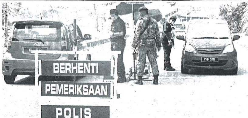
Anggota Polis Diraja Malaysia (PDRM) bersama anggota Angkatan Tentera Malaysia (ATM) ketika melakukan sekatan jalan raya di Zon Kenanga, Amanjaya, Sungai Petani, semalam.

"Kedua-dua kes ini adalah petugas kesihatan di hospital itu, namun tugas tidak membabitkan jagaan kes yang disahkan positif COVID-19.